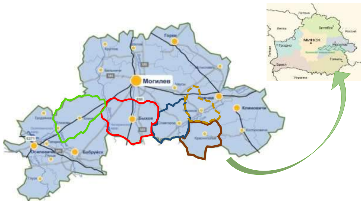
Рисунок 1. Географическое расположение пилотного региона.

Районы-партнеры – Быховский, Кличевский, Краснопольский, Славгородский и Чериковский районы Могилёвской области. Соглашение о сотрудничестве подписано 5 января 2018 года (рис. 1.). В дальнейшем, с согласия районов-партнеров, к ним могут присоединиться и другие районы, заинтересованные в межрайонном сотрудничестве и готовые внести вклад в общее развитие.